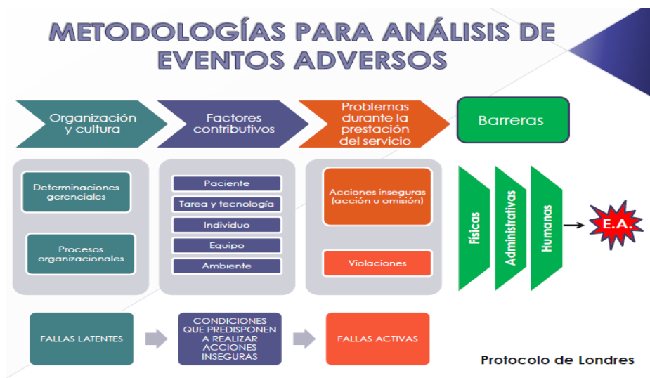
Figura 2. Protocolo de Londres

Cada Prestador de Servicios de Salud es autónomo en elegir la herramienta de análisis de los eventos e incidentes adversos para la evaluación de cada uno de los casos.